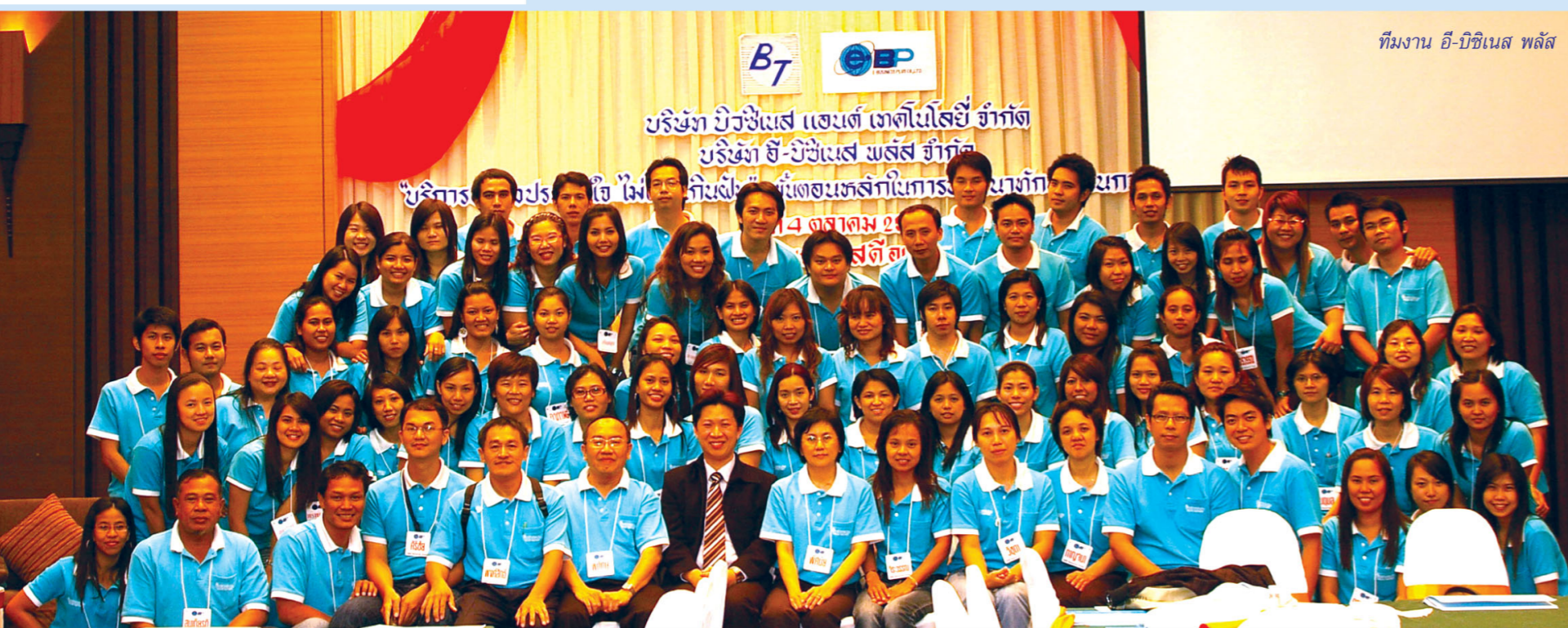
ทีมงาน อี-บิซิเนส พลัส