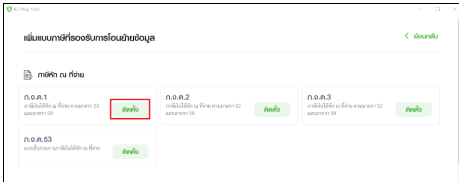
การติดตั้ง การจัดเตรียมข้อมูล ภ.ง.ด.1