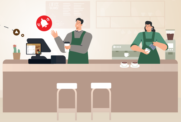
คำสั่งซื้อกาแฟของลูกค้า