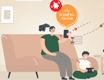
ลูกค้าสั่งซื้อกาแฟ + แจ้งการชำระเรียบร้อยแล้ว