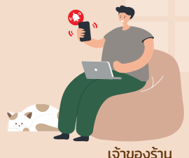
เจ้าของร้าน

รองรับ ข้อมูลยอดขาย ได้ทุกที่ทุกเวลา ด้วย Coffee Executive on Android