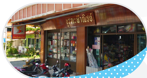
ร้าน บุรีนระพาณิชย์ จ.ตราด