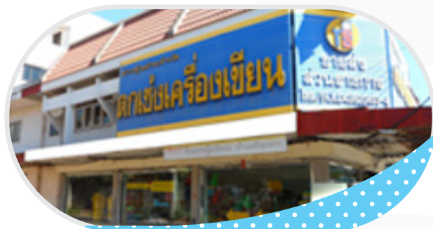
หจก. ตาชั่งเครื่องเขียน จ.กาฬสินธุ์