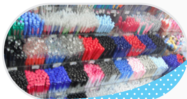
ร้าน บริบูรณ์พาณิชย์ จ.ตราด