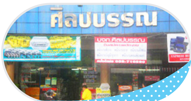
บจก. ศิลบรรณ จ.ชลบุรี พัทยา