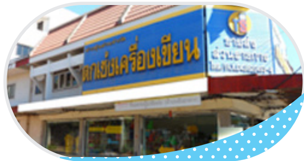
หจก. ตากชิ่งเครื่องเขียน จ.กาฬสินธุ์