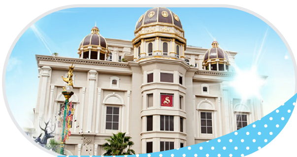
บจก. สยามนครินทร์ จ.สงขลา หาดใหญ่