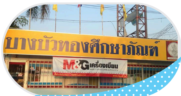
บจก. บางบัวทองศึกษาภัณฑ์ จ.นนทบุรี