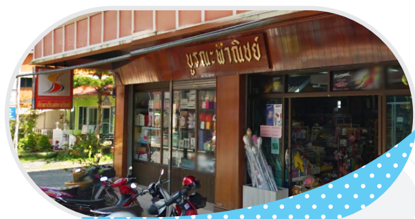
ร้าน บูรณะพานิชย์ จ.ตราด