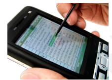
สุดยอดโปรแกรมหน่วยรถ Business plus Van Sales

Business Plus ได้รับการพัฒนาอย่างต่อเนื่องและทันสมัยตามเทคโนโลยี สมบูรณ์แบบที่สุด ถูกต้องตามกฎหมายกรมสรรพากร สะดวก รวดเร็ว ถูกต้องและแม่นยำ มีความยืดหยุ่นในการทำงานสูง มีผู้เชี่ยวชาญในการวิเคราะห์/จัดวางระบบ ทีมงานขายและบริการส่วนกลางที่มีความรู้และความสามารถ มีทีมงานติดตั้ง อบรมการใช้งานอย่างแท้จริงที่บริษัท มีศูนย์บริการและฝึกอบรมลูกค้าอย่างต่อเนื่อง ทันสมัย มีตัวแทนจำหน่ายแต่ละเขต ทั่วประเทศ ที่มั่นคงและมีคุณภาพจนถึงปัจจุบัน ได้รับความไว้วางใจจากลูกค้าทั่วประเทศมากกว่า 10,000 บริษัททั่วประเทศ เน้นลูกค้าซื้อไปใช้งานแล้วประสบผลสำเร็จมากที่สุดเหมาะกับองค์กรและผู้บริหารที่มองการณ์ไกล