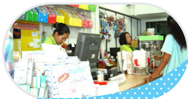
บริษัท เอกวิทย์ฯ จำกัด จ.ระยอง