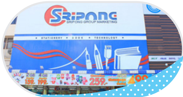
บจก. ศรีพงษ์กรุ๊ป มาร์เก็ตติ้ง จ.อุดรธานี

ส่วนหนึ่งของรายชื่อลูกค้าที่ใช้ระบบ BUSINESS PLUS ACCOUNT & ERP สำหรับธุรกิจเครื่องเขียน