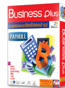
สุดยอดโปรแกรมเงินเดือนสำเร็จรูป Business plus Payroll