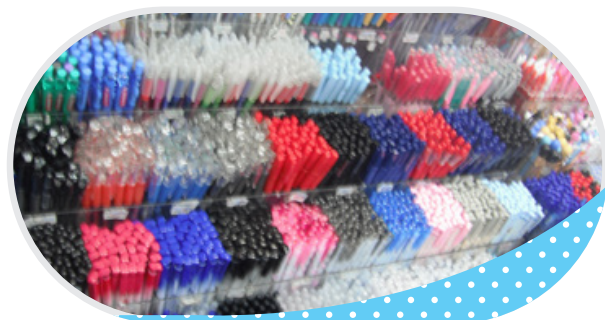
ร้าน บริบูรณ์พานิช จ.ตราด