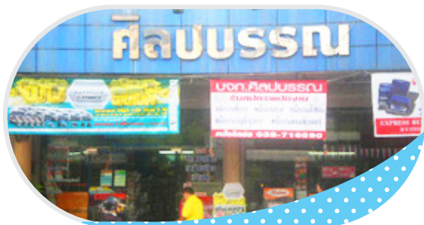
บจก. ศิลปบรรณ จ.ชลบุรี พัทยา