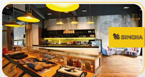
บริษัท สิงห์ เทรนด์ จำกัด แบนด์ "สิงห์ ไลฟ์"