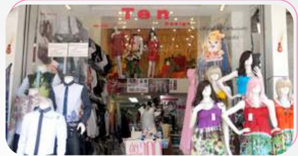
ร้านเทียนดีไซน์ จำหน่ายชุดแฟชั่น ชุดแนววินเทจ