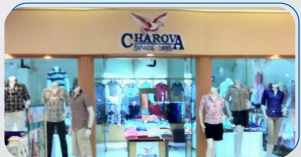
บริษัท จัสโปร การ์เม้นท์ จำกัด แบนด์ "CHAROVA" รับจ้างผลิตตามลูกค้า