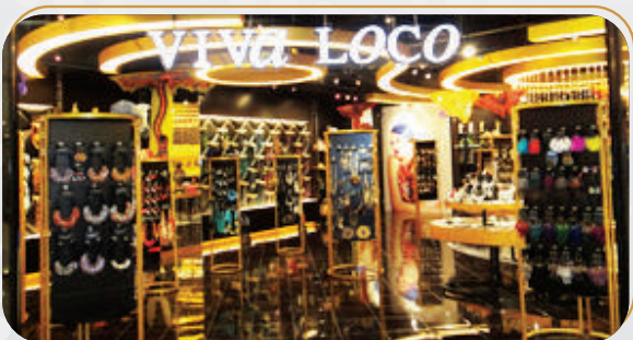
บริษัท วิวา โลโก้ จำกัด จำหน่ายสินค้าแฟชั่น, เครื่องประดับ