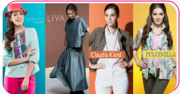
บริษัท พี.เอ็น.แอล จำกัด จำหน่ายเสื้อชุดสตรีสำเร็จรูปชั้นนำ แบรนด์ Pulcinella, Claudia Kleid, Claudia Kleid Black & White, Claudia Kleid Weekend, Milla, Liya