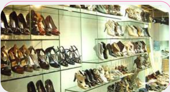
ร้านเทรนด์ดี จำหน่ายรองเท้าแฟชั่น