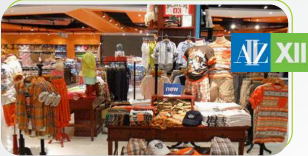
บริษัท เอ ญ แซด คิวส์ (ประเทศไทย) จำกัด ผลิตและจำหน่ายเสื้อผ้า ALZ